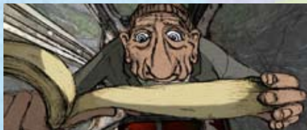
THE CABLE CAR Claudius Gentinetta & Frank Braun 2008