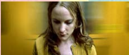
ILLUSION Burhan Qurbani 2008